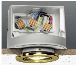
ダウンライト・照明器具に